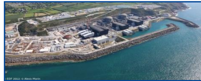
•NUCLEAR (conventional island)