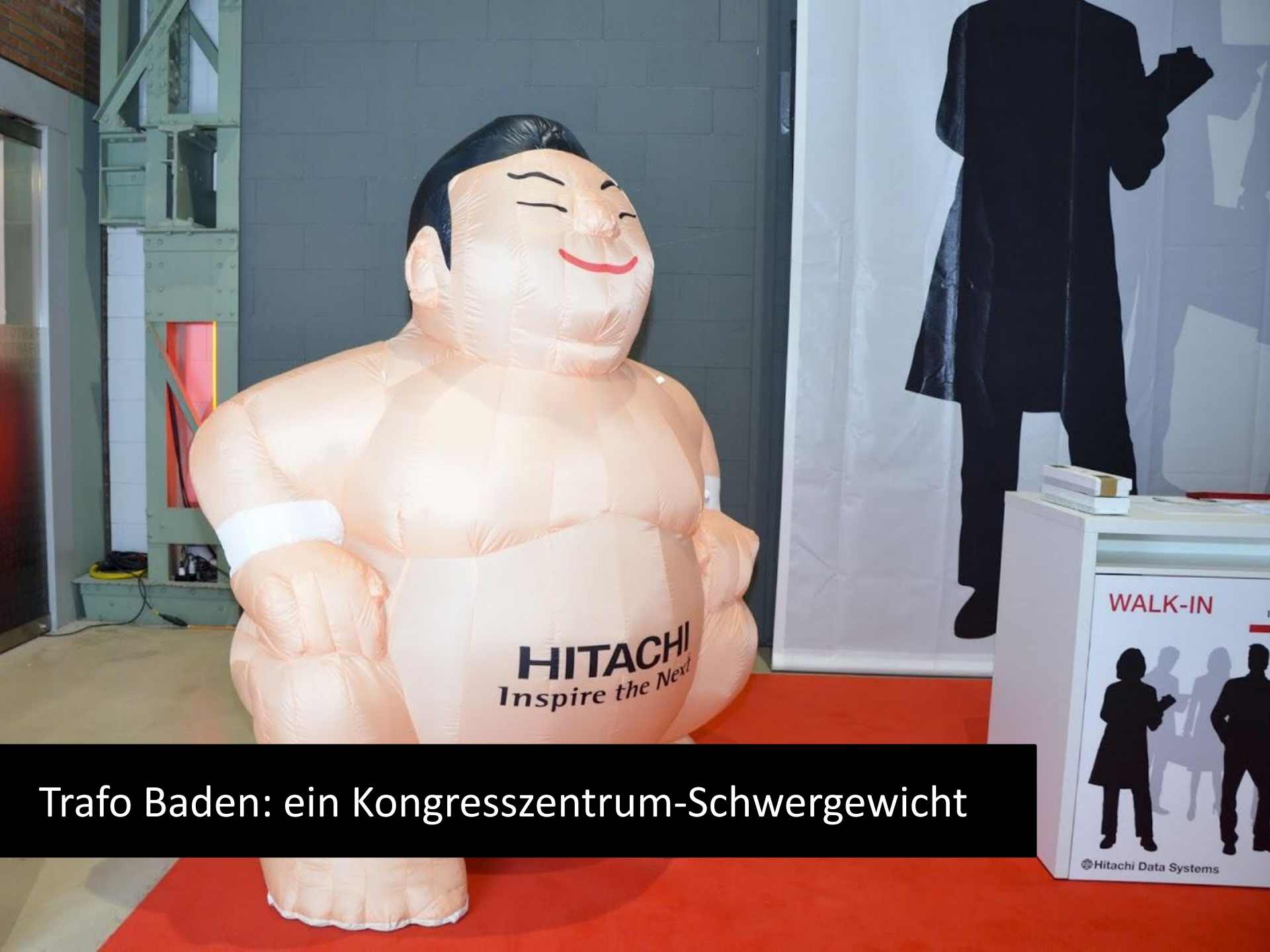
Trafo Baden: ein Kongresszentrum-Schwergewicht